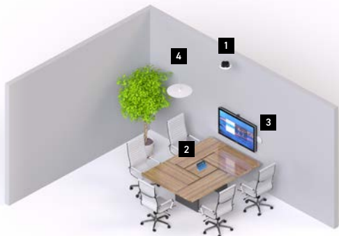
小会議室・ハドルームの構成例

規模や用途に合わせてStemデバイスを組み合わせれば、多様な会議環境へオーダーメイドの音環境を導入することができます。下の設置例は組み合わせのほんの一例です。その他の例は、 www.shure.com/ja-JP/stem をご覧ください。