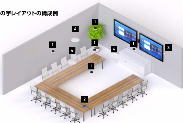
コの字レイアウトの構成例