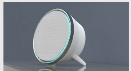
卓上などの平らな面