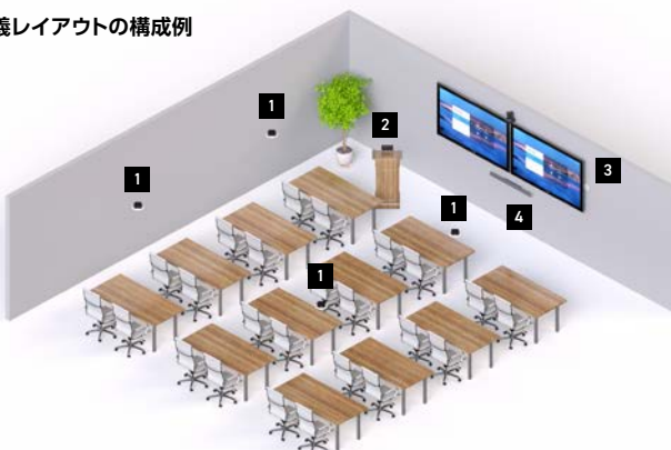
講義レイアウトの構成例