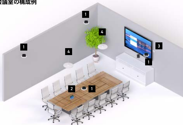
中会議室の構成例